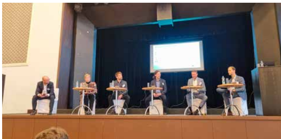
Mezinárodní konference „Sokolovsko inspiruje“