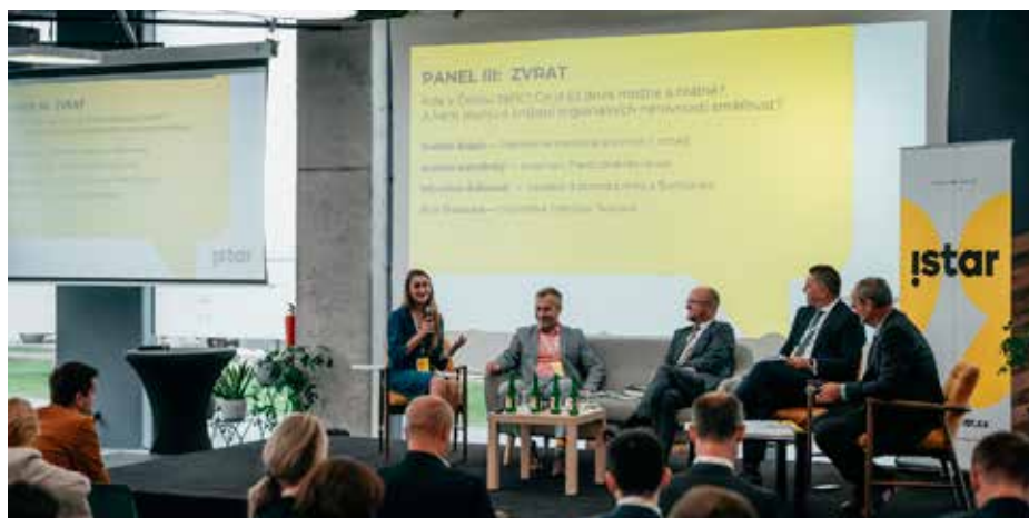
Mezinárodní konference „Na regionech záleží“