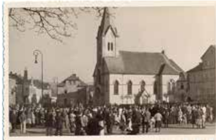
Volební shromáždění v r. 1935 s již stojící farou.