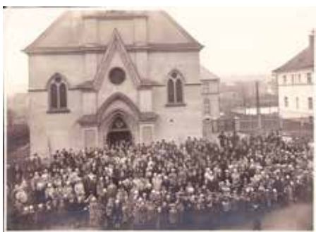
Kostel po dokončení a při vysvěcení 24. 10. 1924