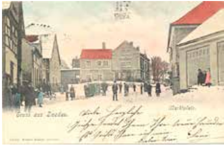
Rok 1905 náměstí bez kostela.