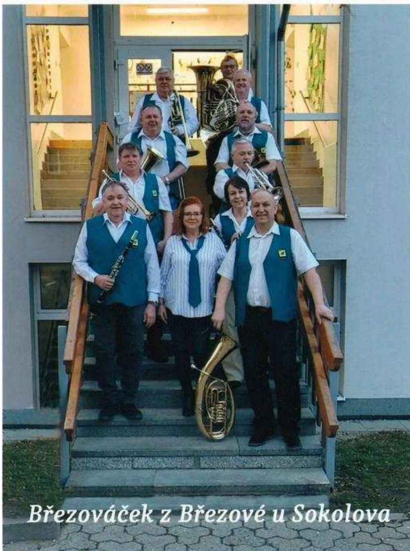
Březováček z Březové u Sokolova

Občerstvení bude zajištěno. Imbiss ist sichergestellt.